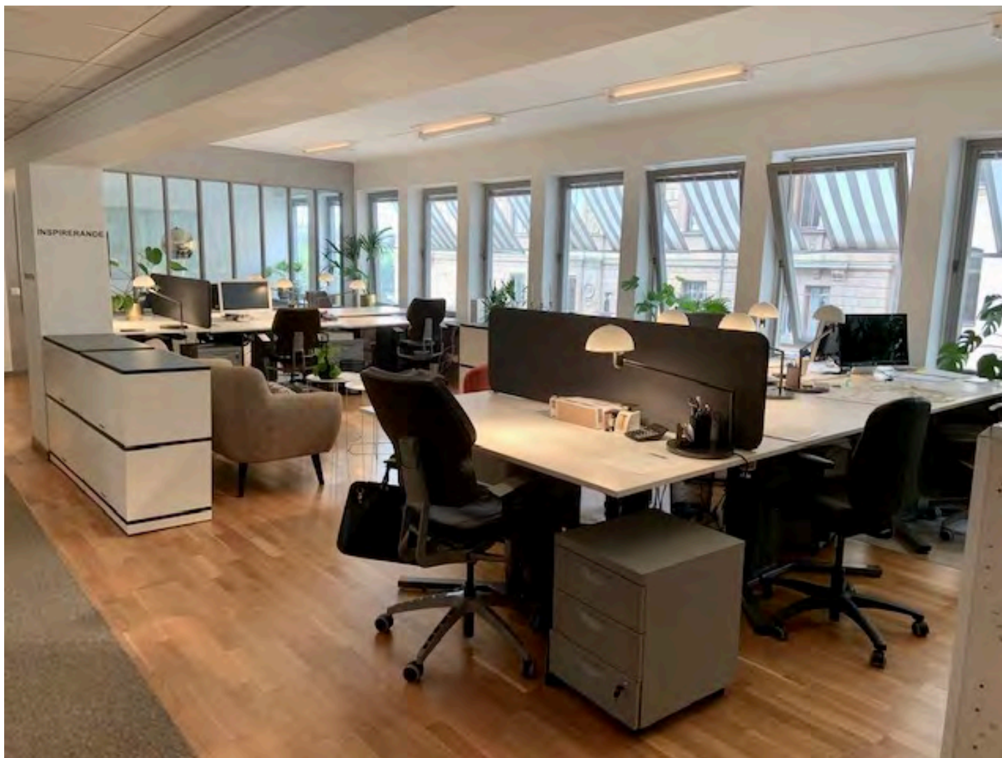
Ljust och fräscht kontor på plan 2